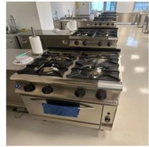
Beslenme Danışmanlığı ve Eğitim Merkezi